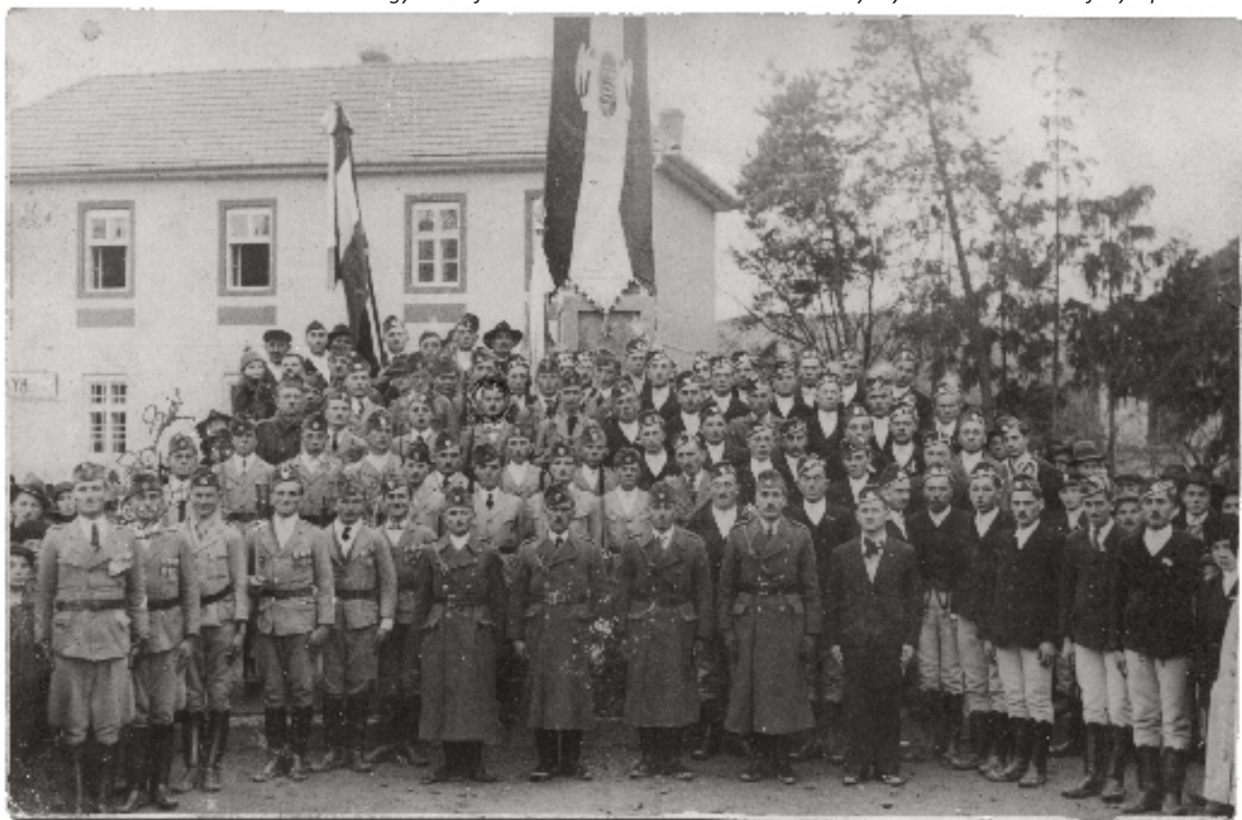
Egy közös felvétel a sárándi és etédi leventékkel