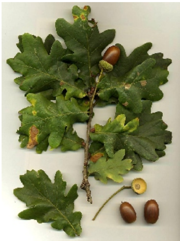
Kocsányos tölgy ( Quercus robur )

Milyen jó, ha nyáron, nagy hőségben fák árnyékában sétálhatunk végig az utcán! Milyen kellemes, ha az utak zaja nem visszhangzik a házak falain, ha a földön felkavart por nem söpör végig a falun a széllel!