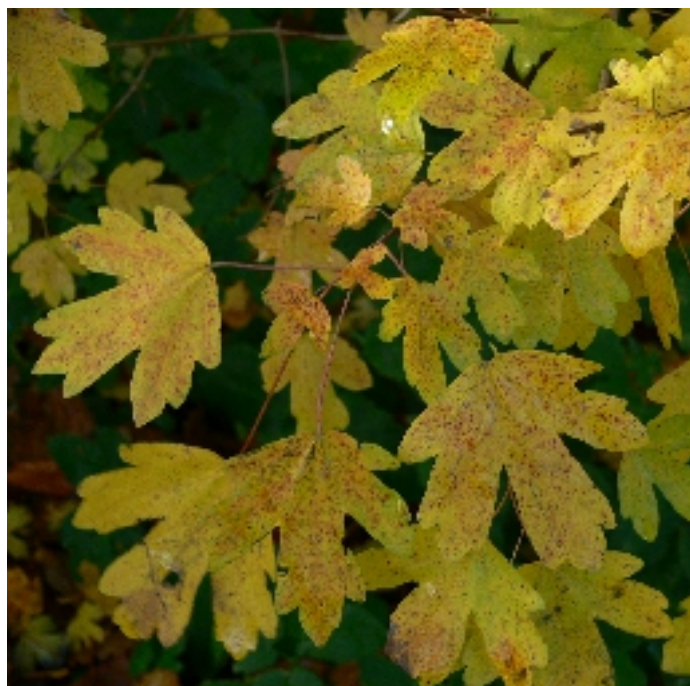
Mezei juhar ( Acer campestre )

Az fa ültetési és örökbefogadási programról és a fa fajok leírásáról a vásári sokadalomban, a környezetvédelmi sátorban lehet majd érdeklődni.