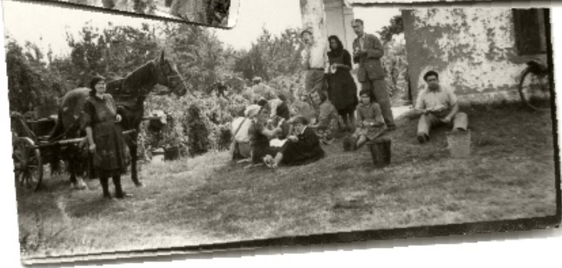
Szüret a Bánom szőlőben anno...