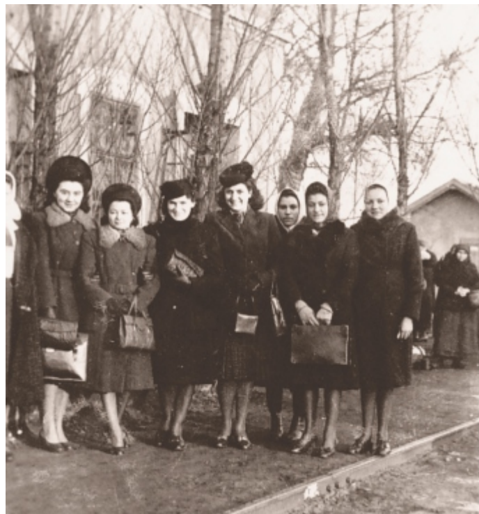
A nagyváradi gyorsra várva a sárándi vasútállomáson.