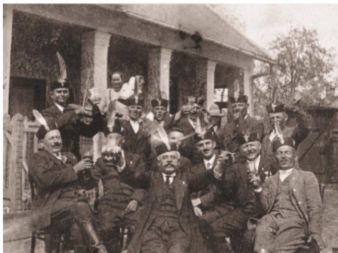
Sárándi dalárda valamikor 1930 táján.