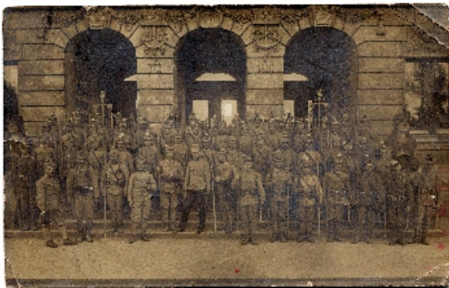
Sárándi bakák az I. világhábrúban