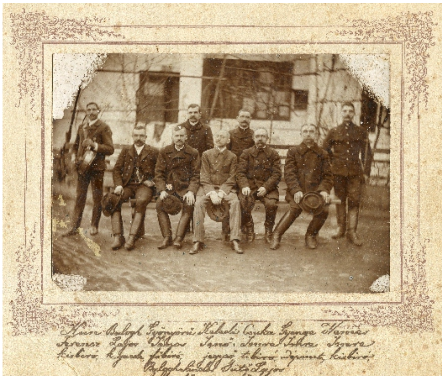
A sárándi eljárárság 1912-ben.