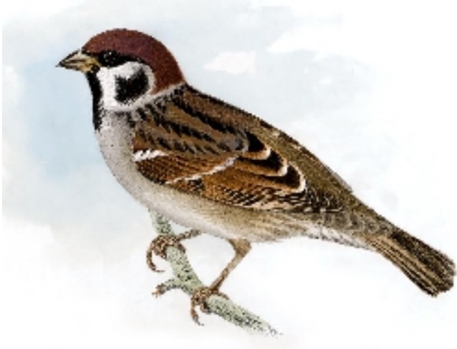
Mezei veréb

Úgy tűnik, mintha már kezdődne a tavasz. Sokan már el is kezdték a kerti munkákat, de a madarak számára a tél még egyáltalán nem ért véget. A tél nem csak a hideget, hanem egy táplálékban szegény időszakot is jelent a madaraknak. Ezért az, aki örömet lelte eddig az etetőn táplálkozó madarak látványában, még ne hagyja abba az etetést.