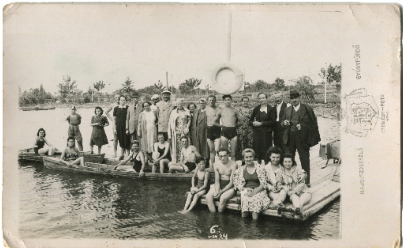
Sárándiak a szoboszlói strandon 1941-ben – hova fejlődött azóta!

Fényképek és szöveg: Kálmánné Szabó Katalin