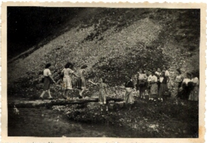
Alföldi lányok a hegyekben. Kirándulás Barátkára a lányegyesülettel.