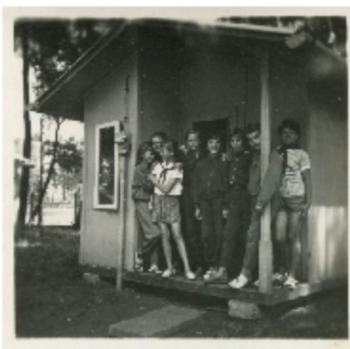
Őrsvezetőképző úttörőtábor Hajdúböszörményben. A szerencsésebbek faházban laktak, a többiek sátorban. Nem volt fényűzés, de boldog, vidám táborozás volt.