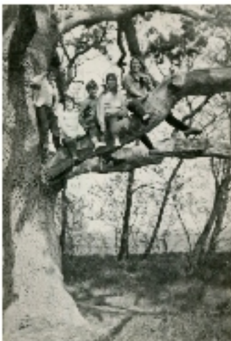
Amikor az ezeréves tölgyfa alsó ágára még fel lehetett mászni.